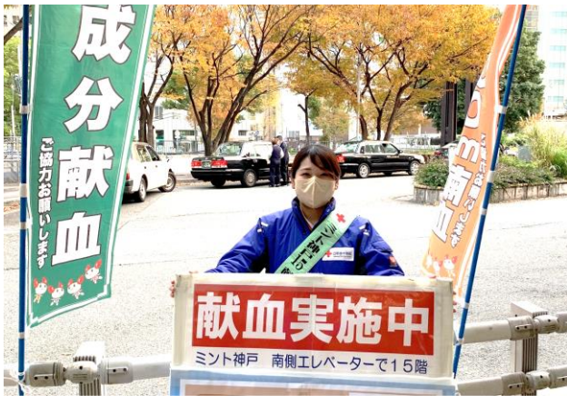
寒風のなか、路上で協力を呼びかける職員

献血はご自宅の近くの献血ルーム・献血バスでもできます、無理のない範囲でのご協力を宜しくお願い致します。