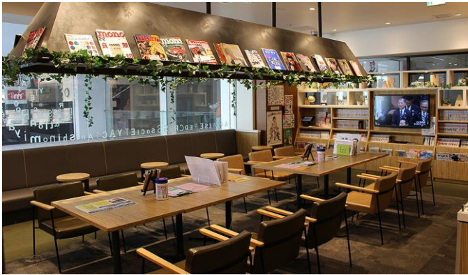
喫茶店をイメージした内装は女性に人気(にしきた)

献血はご自宅の近くの献血ルーム・献血バスでもできます、無理のない範囲でのご協力を宜しくお願い致します。