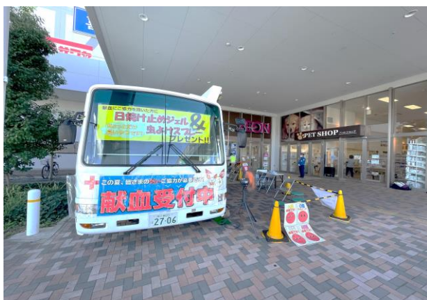
献血バス(イオンモール神戸北にて)

献血はご自宅の近くの献血ルーム・献血バスでもできます、無理のない範囲でのご協力を宜しくお願い致します。