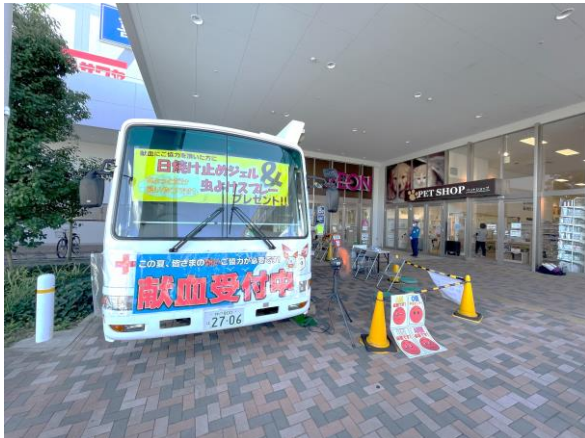
献血バス(イオンモール神戸北にて)

献血はご自宅の近くの献血ルーム・献血バスでもできます、無理のない範囲でのご協力を宜しくお願い致します。