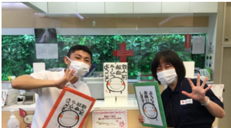
職員一同、いつも笑顔でお待ちしております (新長田鉄人前献血ルーム)